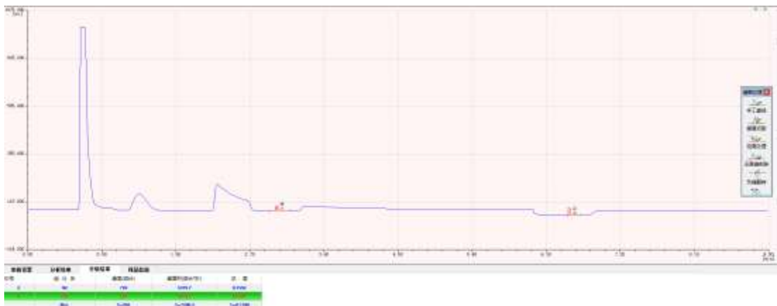
图3 （0.1-40）%氮氧混合气色谱分离图

通过实验证明，色谱柱分离温度在55℃恒温时，（0.1-40）%氮氧混合气中氧气+氩气、甲烷、一氧化碳和二氧化碳各组分分离效果良好，分离度R均大于2，能够满足测定要求。